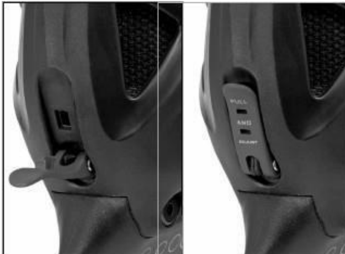
Abb. | Picture | Fig. | Fig. | Ill. | Abb. 2